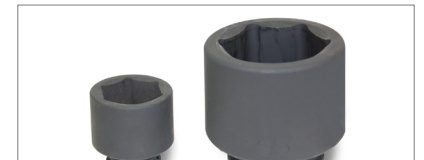
Ağır Lokma / Socket