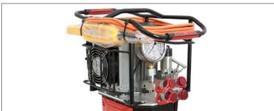
Elektrikli Pompa / Electric Pump