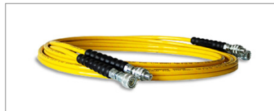
İkiz Hortum / Twin Hose